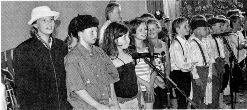
Die jungen Darsteller sangen gemeinsam die Lieder des Rote-Zora-Musicals. MESSERSCHMIDT (2)